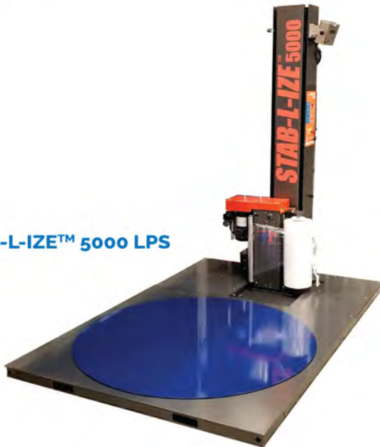
STAB-L-IZE™ 5000 LPS